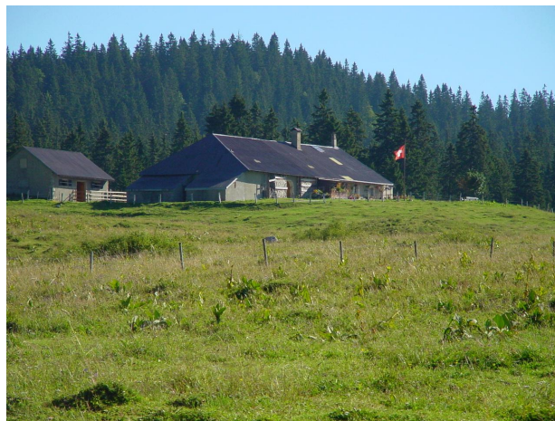
Figure 2: Chalet d'alpage du Pré d'Aubonne