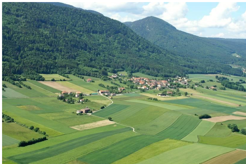
Figure 4 : forêt, agriculture et bâti, trois piliers pour l'avenir du Parc Naturel Régional Jura Vaudois