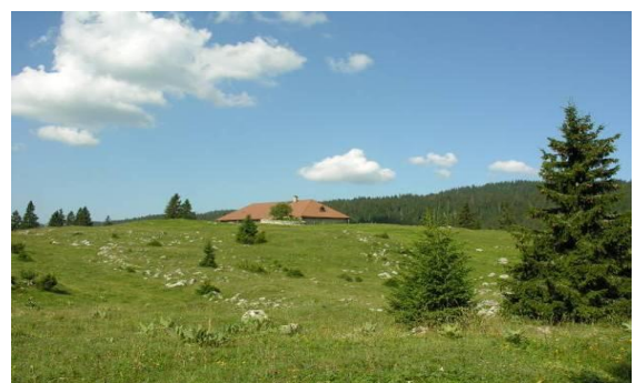
Figure 1: les alpages, hauts lieux du patrimoine culturel et naturel du Parc Naturel Régional Jura Vaudois