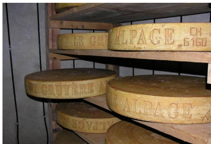
Figure 3: le gruyère d'alpage AOC, un des produits phares de l'économie locale

Le Parc favorise l'essor économique et social des communes membres dans le respect d'un développement durable . Cela implique un soutien à l'économie locale par le renforcement des circuits régionaux. Le développement de produits touristiques, ainsi que le soutien à des projets forestiers ou agricoles (participation aux projets OQE [Ordonnance sur la qualité écologique], participation aux projets de valorisation des produits régionaux, gestion des alpages, ...) sont actuellement mis en place.