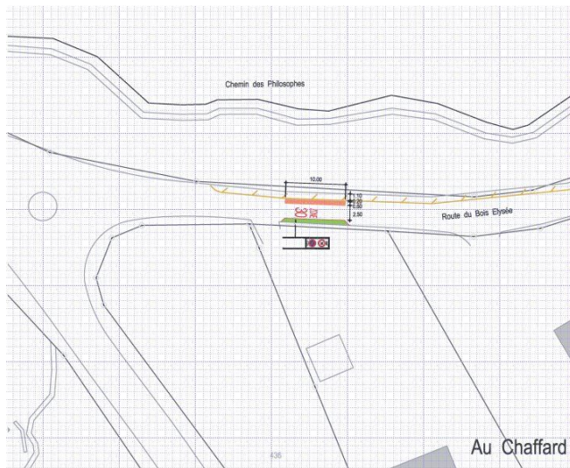
Zone 30 - Porte principale - Rte du Bois de l'Elysée

Modération similaire à celui de la rte Neuve à l'exception d'un rétrécissement plus important. Par ailleurs, le carrefour Hermanjat - Bois Elysée présente des problèmes de sécurité pour le trafic tournant à gauche dans la direction Montherod - Bois Elysée. Celui-ci est à améliorer indépendamment de la zone 30.