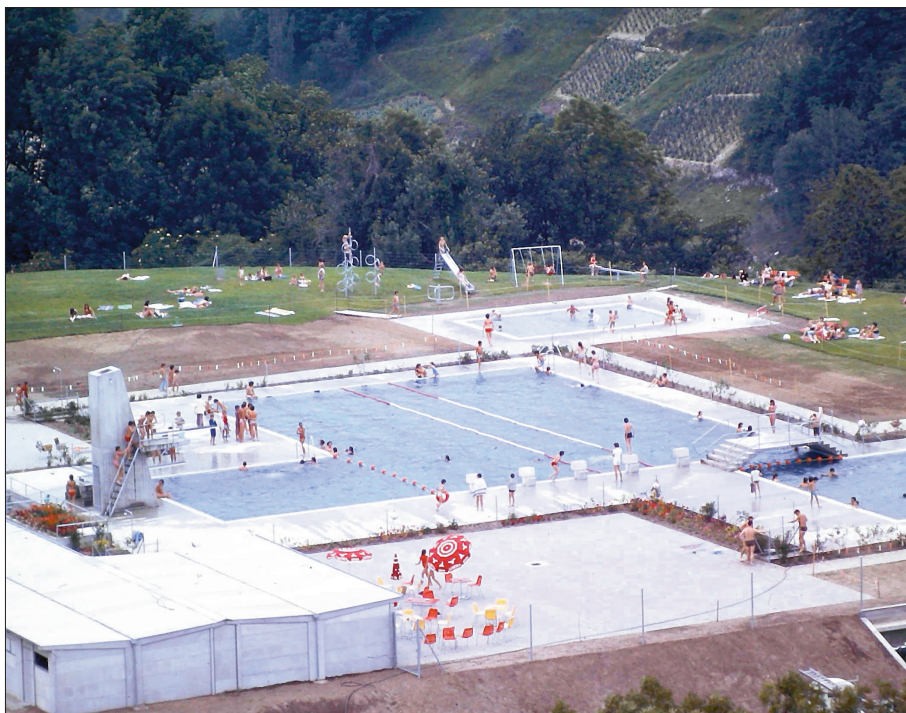
La piscine encore en pleins travaux... Quelques mois plus tard, en été 1972, les premiers utilisateurs en profitent déjà.