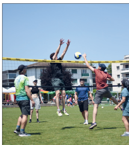
L'effort était aussi vertical !