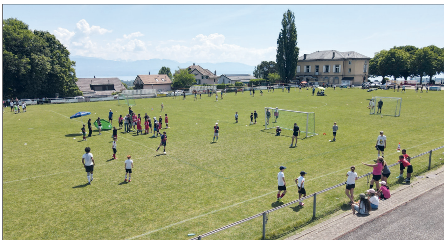
Les terrains du Chêne ont fait le plein pour « Sport en fête ».

Dédié une nouvelle fois à l'activité physique, le mois de mai a vu de nombreux partenaires ouvrir leurs portes et offrir des initiations. La journée « Sport en fête » du 25 mai a bénéficié d'une météo fantastique et attiré des centaines de participants.