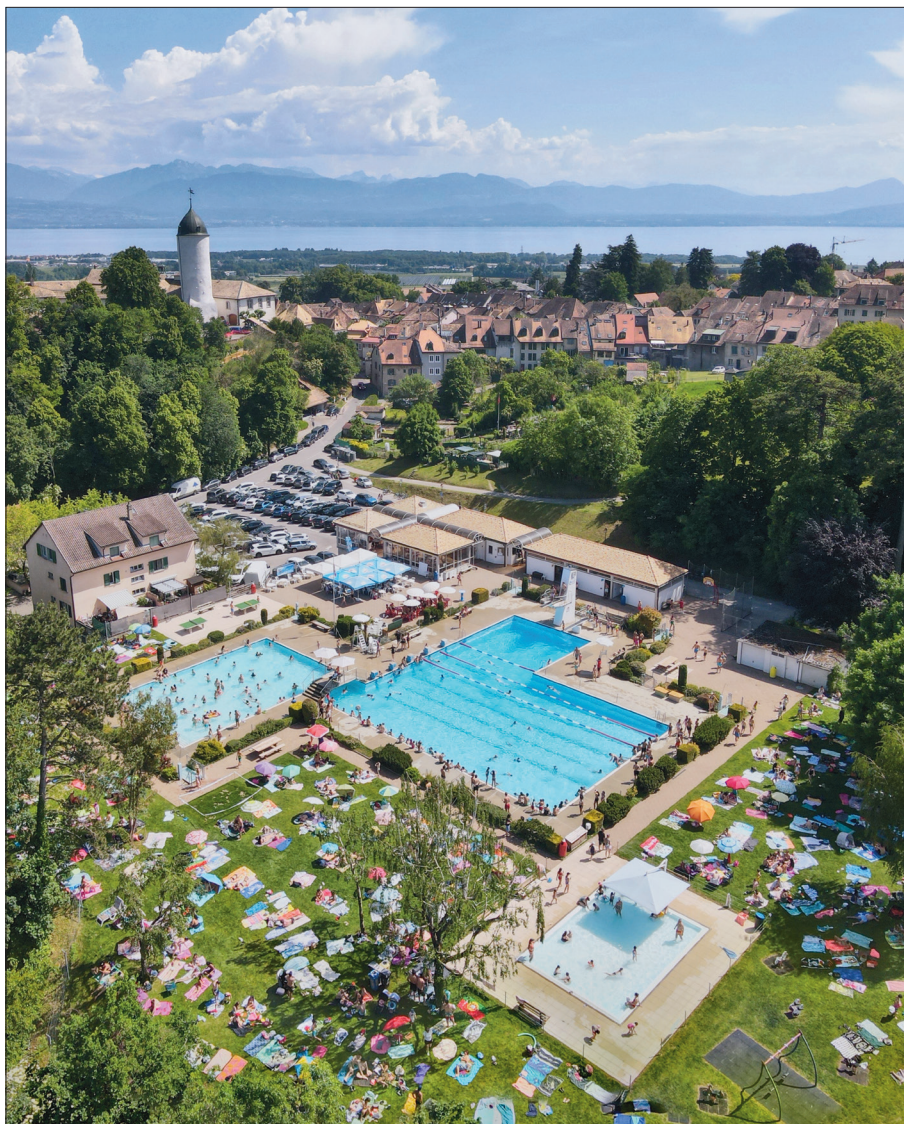
La chaleur torride du lundi de Pentecôte a valu à notre piscine sa première grosse affluence de la saison 2026.

Malgré les soins continus et les mises en hivernage à la fin de chaque saison, notre piscine finit par accuser son âge avancé. Ses coûts à charge de la Commune le reflètent: de 171 000 francs en 2011,