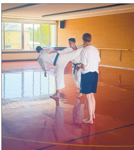
Le shorinji kempo en demo.