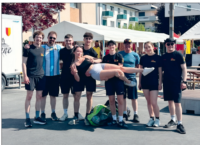
La Gym Aubonne a dirigé la séance d'échauffement du matin.