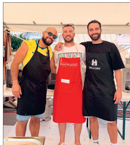
La cuisine : un sport d'équipe !